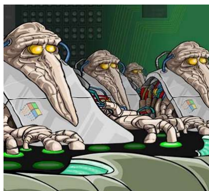
Qui contrôle le contrôle ?

10 - Par ailleurs, j'attire votre attention sur le fait que, sur le plan économique, ce projet de loi ne sert principalement qu'une poignée d'entreprises extra-européennes travaillant dans l'électronique grand public, le logiciel et les services en ligne.