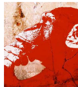
Peser le pour et le contre

L'ADAMI et la SPEDIDAM, sociétés de gestion collective, qui défendent à elles deux les droits de plus de vingt-cinq mille artistes français, l'ont d'ailleurs bien compris puisqu'en compagnie des principales associations de consommateurs et de familles françaises (UFC, CLCV, UNAF), elles contestent aussi le contenu du projet de loi DADVSI.