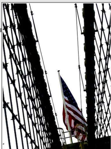
L'Europe ? C'est tout droit ?