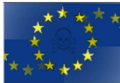
États-Unis, Commission, Conseil, ... Ils piratent la démocratie européenne !

Surtout quand on sait que les menaces de la Commission font suite à la signature discrète, par le président de la Commission et celui du Conseil le 20 juin 2005 à Washington, d'un accord bilatéral avec les États-Unis sur la propriété intellectuelle, négocié par la direction générale du Commerce avec une délégation du secrétariat d'État au Commerce américain.