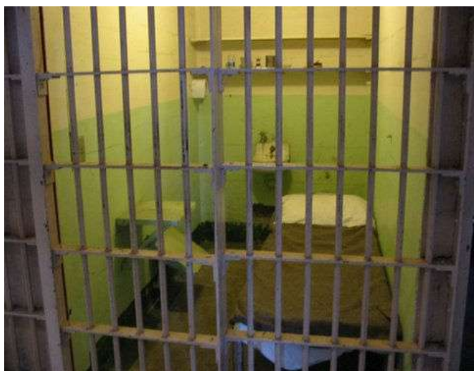
L'avenir des ingénieurs français ?

12 - L'insécurité juridique est une arme de guerre économique redoutable surtout quand elle apparaît sur un marché stratégique ultra-concentré et dominé par des acteurs étrangers.