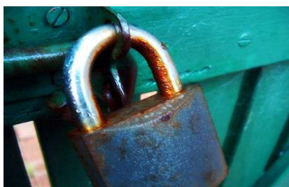
Culture verrouillée, patrimoine en danger

18 - Les effets sur le domaine public et la mission des bibliothèques pourraient être aussi importants. À ce sujet, je vous suggère d'écouter cette intervention ( http://euclid.info/113.shtml ) extrêmement claire de Loïc Dachary, trésorier de la Free Software Foundation (FSF), et un des plus anciens contributeurs français au projet GNU ( http://gnu.org ), ensemble de logiciels libres classé Trésor du Monde par l'UNESCO.