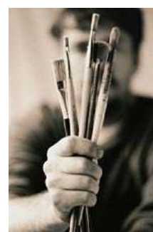
Le choix des armes

Je tiens à vous exprimer ma vive inquiétude pour l'avenir du droit d'auteur français au regard du contenu de ce projet de loi et de la procédure d'urgence choisie.