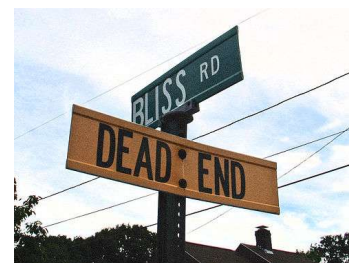
Le DADVSI, cette impasse

Même si l'expérience orwellienne qu'il propose n'est pas menée à terme, les conséquences sociales, économiques et stratégiques pourraient être importantes s'il était adopté en l'état et commençait à être appliqué par des juges.