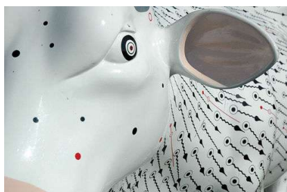
... la vache à lait électronique va ruer.

23 - Ce manquement de la Commission est d'autant plus regrettable qu'il semble aujourd'hui difficile de transposer la directive 2001/29CE sans avoir les solutions de la Commission aux trois problèmes majeurs déjà identifiés lors de la revue de transposition qui s'est tenue le 11 octobre 2004 à Bruxelles sous son égide.