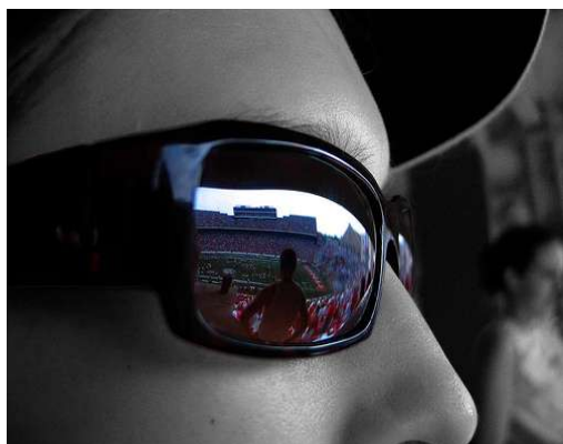
Informatique de "confiance" ou guerre du sens ?

4 - Si la CNIL s'opposait au déploiement de tels dispositifs, la protection juridique des mesures techniques réputées efficaces – selon les termes de la directive – ne servirait à rien dans le cadre de la lutte contre les usages non autorisés (par la loi ou arbitrairement), puisque, au regard de l'état de la technique, les mesures techniques ne pourront prétendre être efficaces que si elles s'appuient sur des puces cryptographiques à identifiant unique, et que si elles prévoient la possibilité de révocation de clé par un serveur distant en cas de diffusion d'une faille les concernant.